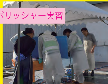
ハンドポリッシャー実習

各人石と対話する姿はとても頼もしく、指導しながらも毎回感激してしまいます。一日で匠になることはできませんが、千里の道も一歩から。まずは作品と加工の技術を見る、道具を使ってみる、真似してみる、そして資格に挑戦!