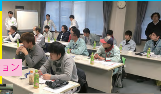
座学オリエンテーション