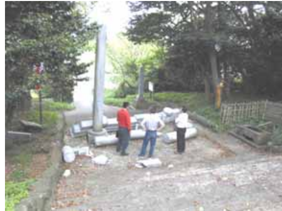
緩傾斜地に建つ「藤懸神社」の倒壊した三段笠の鳥居(宇寿石) <震央至近の能登金剛、志賀町笹波>

約60cm 嵩上げされた石組台座上に平成14年頃再建された三つのお墓。手前のお墓はベタコンクリート基礎床に板石を敷き、墓石を載せている。その周りは玉砂利が厚さ3-4cmまかれている。下台から棹石まで全体が約15cm右手に移動したが、転倒しなかった。右手奥の二つのお墓は、基礎床が十分に転倒したが、棹石などには大きな傷がつかず元に戻された。<輪島市門前町走出の總持寺祖院龜山墓地>