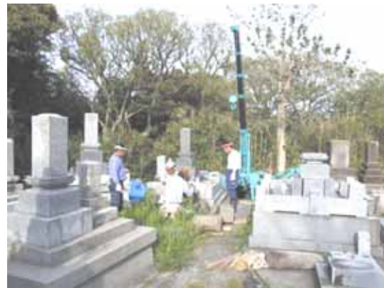
この墓地では90%以上転倒した。狭い通路にクレーンを立てて修復中。

<震央至近の輪島市門前町赤神、道の駅から約50m上の丘陵の老人ホームに北隣する墓地>