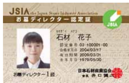
お墓ディレクター1級IDカード(見本)