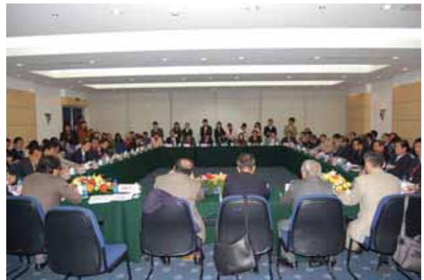
日中石材業界サミットの様子