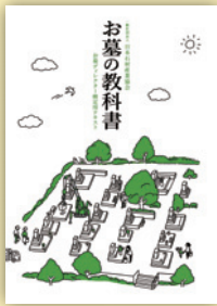
検定用テキスト お墓の教科書

定価 16,200 円(税込) ※会員価格 8,640 円(税込) 2014年9月発行