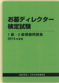
試験対策の決定版！ 模擬問題集2014年度版