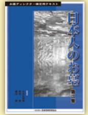
参考資料 日本人のお墓 第二集

定価 8,100 円(税込) ※会員価格 4,320 円(税込) 2003年8月発行