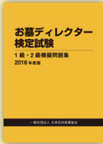
試験対策の決定版！ 模擬問題集2016年度版

定価 16,200 円(税込) ※会員価格 8,640 円(税込) 2014年9月発行