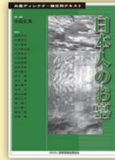
参考資料 日本人のお墓

定価 8,100 円(税込) ※会員価格 4,320 円(税込) 2003年8月発行